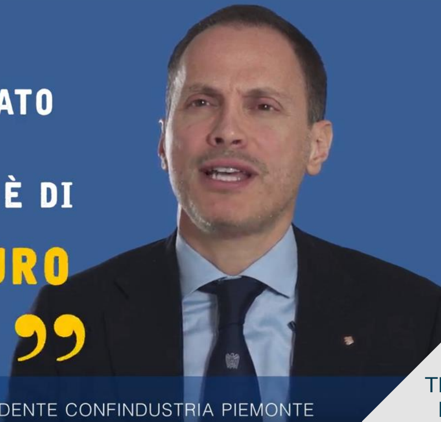
FABIO RAVANELLI, PRESIDENTE CONFINDUSTRIA PIEMONTE

COSTO DELLA TRATTA TRANSFRONTALIERA 8,6 mld