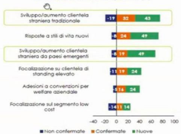
Piemonte: le strategie identificate per aumentare in futuro la competitività (%)

Nota: indagine svolta da Intesa Sanpaolo su un campione di 588 imprese alberghiere italiane con codice Ateco 55.1, di cui 37 piemontesi.