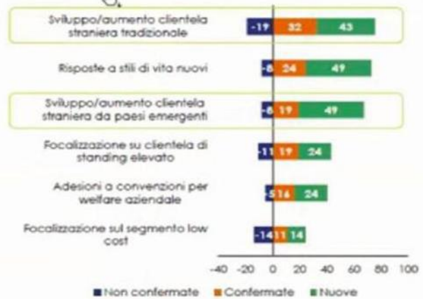
Piemonte: le strategie identificate per aumentare in futuro la competitività (%)

Nota: indagine svolta da Intesa Sanpaolo su un campione di 588 imprese alberghiere italiane con codice Ateco 55.1, di cui 37 piemontesi.