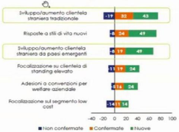
Piemonte: le strategie identificate per aumentare in futuro la competitività (%)

Nota: indagine svolta da Intesa Sanpaolo su un campione di 588 imprese alberghiere italiane con codice Ateco 55.1, di cui 37 piemontesi.