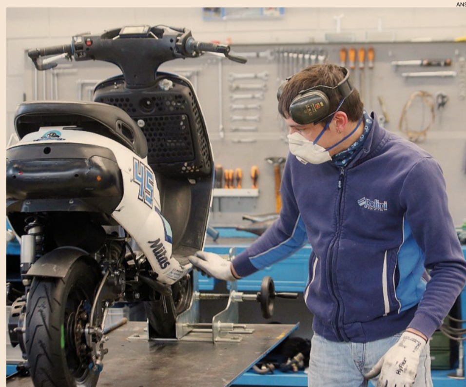
Mascherine. Il premier Conte venerdì ha assicurato la distribuzione gratuita di guanti e mascherine ai lavoratori

«Il messaggio è che la salute e la sicurezza vengono prima dei profitti e delle rendite», ha commentato il leader della Cgil, Maurizio Landini e «nessuno deve restare da solo o deve essere licenziato». Quanto agli scioperi annunciati, Landini guardando alle nuove misure del Dl atteso per oggi in consiglio dei ministri, ha ag-