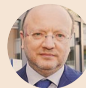
Vincenzo Boccia Per il presidente di Confindustria l'accordo consentirà di superare questa fase delicata, per poi agganciare la ripresa economica quando l'emergenza sarà finita

Le fabbriche italiane si mettono al servizio del paese. Affrontando con coraggio l'emergenza sanitaria, senza spegnere il motore dell'economia. «In questo momento storico va un grazie a tutte le imprese e ai lavoratori per questo grande atto di responsabilità verso il paese», ha commentato Vincenzo Boccia, dopo l'accordo sulle misure di sicurezza nei luoghi di lavoro. La trattativa è durata tutta la notte tra venerdì e sabato e il presidente di Confindustria ha «dato atto al governo» sia dell'immediatezza della convocazione sia di essersi impegnato a fondo per riuscire ad arrivare all'intesa.