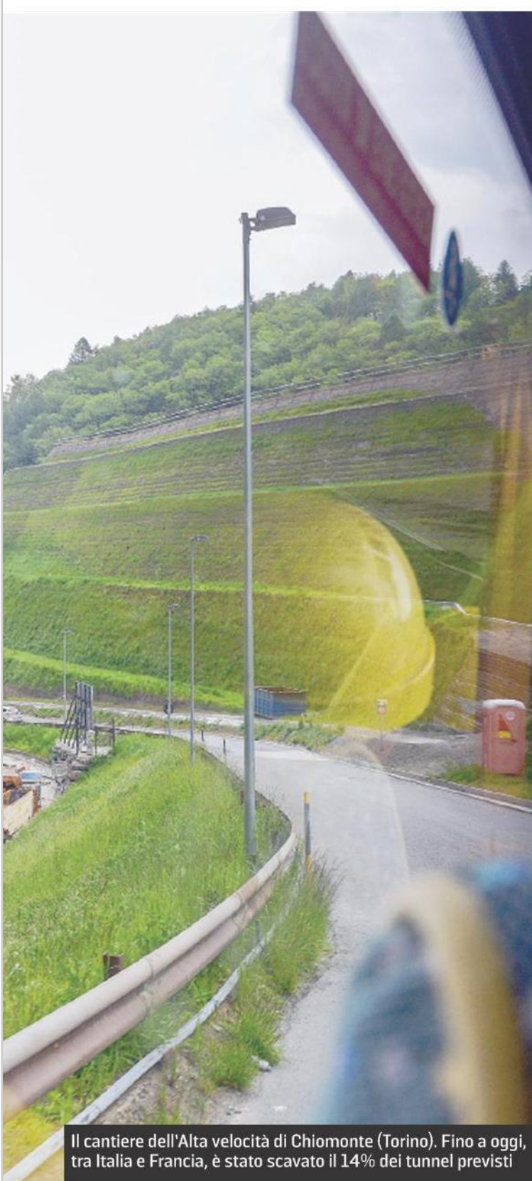
Il cantiere dell'Alta velocità di Chiomonte (Torino). Fino a oggi, tra Italia e Francia, è stato scavato il 14% dei tunnel previsti